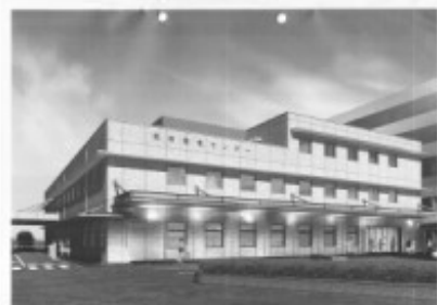
←救命救急センター 完成予想図